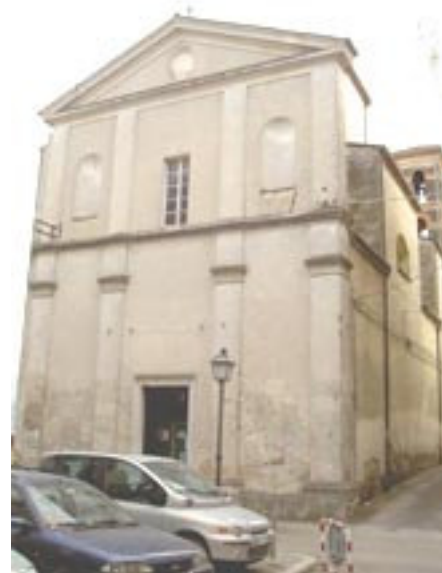
Chiesa di San Paolo Apostolo Pontecorvo

Sostenuti dall’Apostolo Paolo, camminiamo con gioia e coraggio nella via del Vangelo!