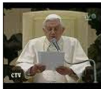
*Sua Santità Benedetto XVI*

In questo mondo dobbiamo opporci alle illusioni di false filosofie e riconoscere che non viviamo di solo pane, ma anzitutto dell'obbedienza alla parola di Dio.